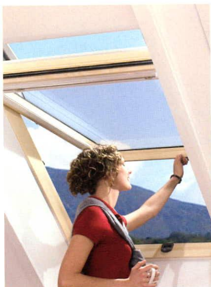
Designo R7 fa tetőtéri ablak

Könnyű és biztonságos takarítás tisztító állásban