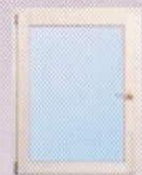
Bánfatherm (H1) egyszárnyú ablak