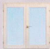
Bánfatherm (H1) kétszárnyú ablak