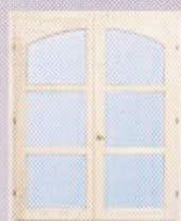
Belsőíves kazettás (design) ablak kétszárnyú